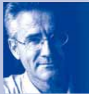
ANDRÉ COMTE-SPONVILLE Philosophe, écrivain et conférencier

Une approche philosophique de quelques questions fondamentales